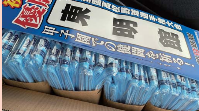
8月10日(火) 東明館甲子園

母校の東明館が甲子園に初出場。佐賀県大会で優勝が決まったからは同級生中心に支援を募り、後輩の勇姿を見守りました。