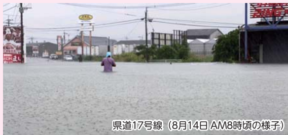
県道17号線（8月14日AM8時頃の様子）

動の影響による気象変動は、これまでと全く異なるものであり、これまでの考え方を改めるべき状況になっている」「住民の皆様の不安を解消するためには、一定の方向性を示していく必要がある」「来年の雨期に向けて対応していきたい」という趣旨の答弁があり、今後の対応に期待したいと思います。