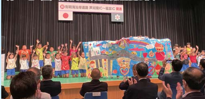
7月24日(生) 有明海沿岸道路開通記念式典

芦刈南 IC ~ 福富 IC 間が開通し、まちを挙げての式典でした。景色も有明海を一望できます。最寄りの際はぜひご利用いただきたいです。