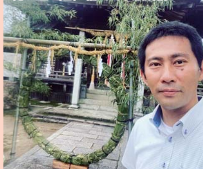
8月1日(日) 輪くぐり願成就

地元の水影天神社の毎年恒例の祭典。先輩に教えていただきながら、私も輪を作らせていただきました。無病息災を願うばかりです。