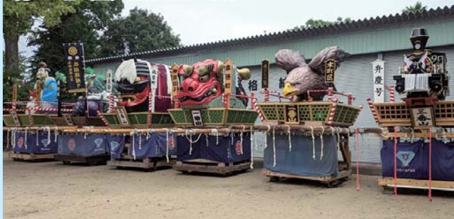
7月17日(生) 鳥栖山笠の展示

新型コロナウイルスの影響で山車の展示のみが行われました。はやくまちを闊歩しながら家族や仲間達と楽しみたいです。